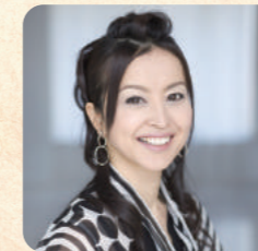
大桃 美代子さん タレント

※手話通訳があります。 保育室の利用申込など詳しくは、 ねりま区報11月1日号をご覧ください。